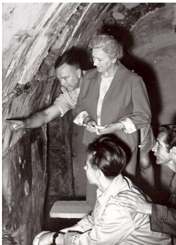
Badania malowideł ściennych i opracowanie metod ich konserwacji w cerkwi św. Petki Samardzijskiej w Sofii (Bułgaria), 1957 r.